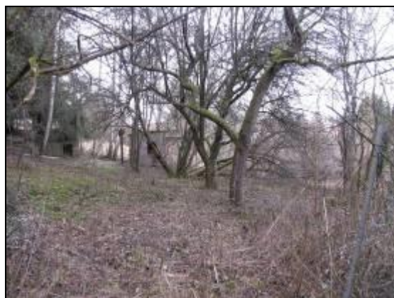
Abb. 13: Sonstiges Gebüsch im Westen (ehemalige Gärten)

Im westlichen Randbereich hat sich eine größere Gebüschfläche entwickelt, die aus ehemaligen Gärten hervorgegangen ist. Aufgegebene kleine Gebäude einer ehemaligen Gartennutzung bezeugen dies. Während im Randbereich dichte Baumhecken vorherrschen, ist das Zentrum der Gebüschfläche durch alte Obstbäume geprägt. Der Unterwuchs ist hier nur gering ausgeprägt und der Gehölzunterwuchs beschränkt sich großteils auf Brombeer- und Himbeerranken. Typische Gehölzarten der Gebüschfläche sind Vogelkirsche ( Prunus avium ), Schwarzer Holunder ( Sambucus nigra ), Schlehe ( Prunus spinosa ), Birke ( Betula pendula ) und Hasel ( Corylus avellana ). Rosenranken, Schneeglöckchen und Walderdbeere sind vermutlich noch auf die ehemalige Gartennutzung zurückzuführen. Im südlichen Randbereich der Gebüschfläche wurden vor Kurzem einzelne Gehölze gerodet.