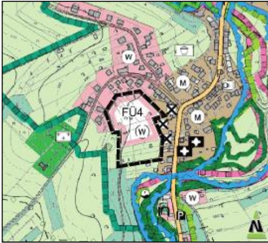
Abb. 11: derzeitige Darstellung

ca. 0,93 ha Sonderbaufläche mit der näheren Zweckbestimmung „Seniorenzentrum“ (§ 1 Nr. 1 Nr. 4 BauNVO)