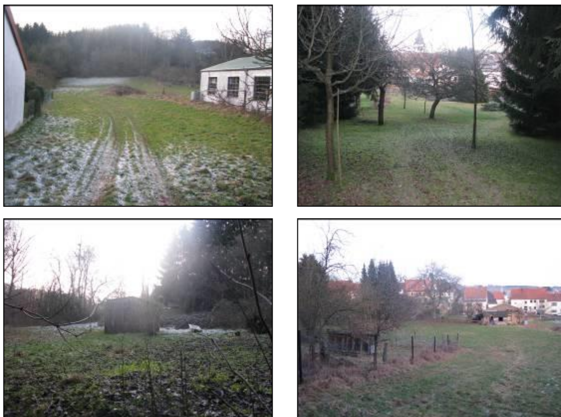
Abb. 5-8: Impressionen vom Plangebiet

Eine genaue Bestandsaufnahme ist dem Umweltbericht zu entnehmen.