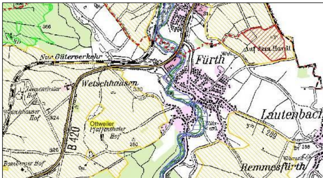
Abb. 10: Auszug aus dem LEP Teilabschnitt „Siedlung“

Die vorliegende Planung steht somit nicht in Konflikt zu den Vorgaben des LEP Teilabschnitt „Umwelt“.