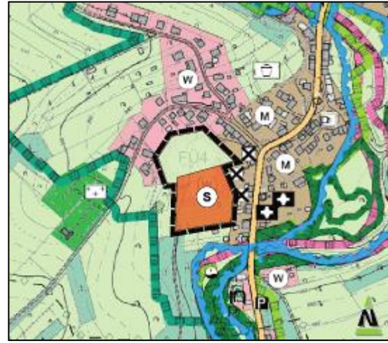
Abb. 12: geplante Darstellung