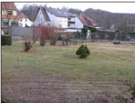
Abb. 15: Zier- und Nutzgärten der Wohnbebauung „Brückenstraße“

Im Süden ragen die privaten Wohngrundstücke der Wohnbebauung „Brückenstraße“ mit ihren Zier- und Nutzgärten in das Plangebiet hinein. Sie nehmen ein gutes Viertel des Geltungsbereiches ein und sind durch Beete, Ziergehölze, Wege sowie Obstbäume geprägt. In den Rasenflächen dominieren anspruchslose Arten der Trittrasengesellschaften.