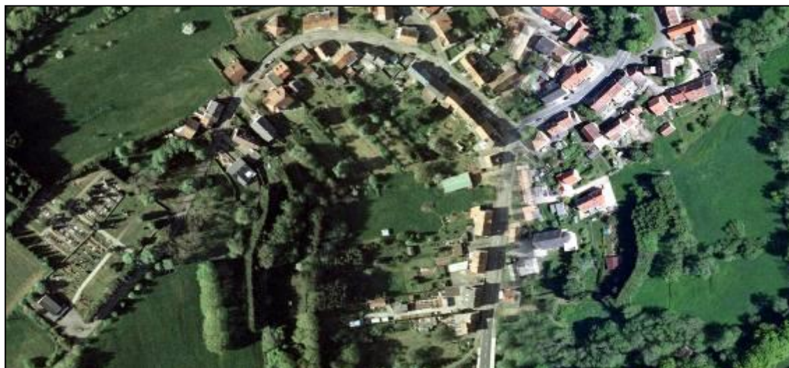
Abb. 4: Luftbild