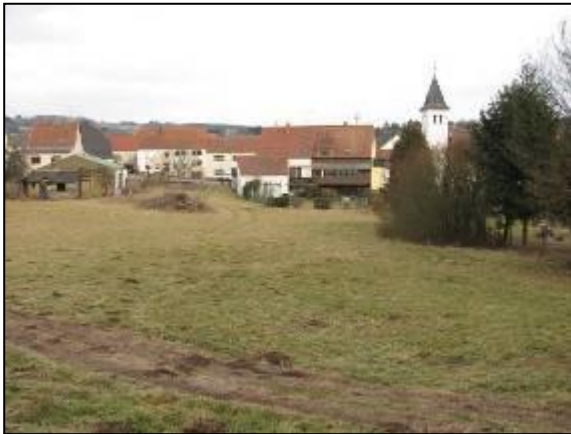
Abb. 14: Wiesen des nördlichen Plangebietes

Für den Arten- und Biotopschutz ist die Glatthaferwiese von mittlerer Bedeutung.