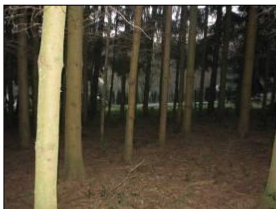
Abb. 17: Ziergehölzbestände, bestehend aus Fichte und Douglasie

Für den Arten- und Biotopschutz sind die Ziergehölzbestände nur von geringer Bedeutung.