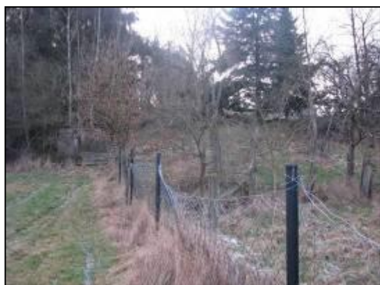
Abb. 16: Private Obstwiese, verbrachend

Für den Arten- und Biotopschutz besitzt die Gartenbrache durchschnittliche Bedeutung.